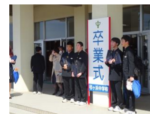
卒業式を終えて門出の一枚

自分でできることをふやす...「自立」。自分をコントロールできる...「自律」。そしてちがいを認め合ってすこす...「共生」です。この三つを生活の中で心がけて下さい。