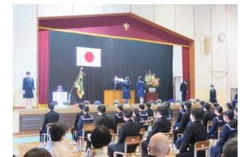
一人一人に卒業証書を授与

八十六名の卒業生の皆さん、ご卒業おめでとうございます。先ほど、一人一人に弓ヶ浜中学校の卒業証書を授与いたしました。九年間の義務教育を修了した証です。