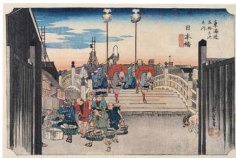
《東海道五拾三次之内 日本橋 朝之景》大判錦絵