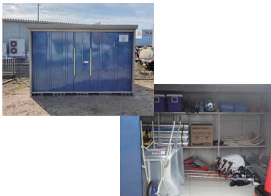
岡 地域振興課 (☎23-5371)

このたび、自治総合センターの宝くじ社会貢献広報事業の助成を受け、大和地区佐陀新町自治会にコミュニティ活動のための備品が整備されました。整備された備品は、地域の環境美化活動、イベント活動などに活用される予定です。