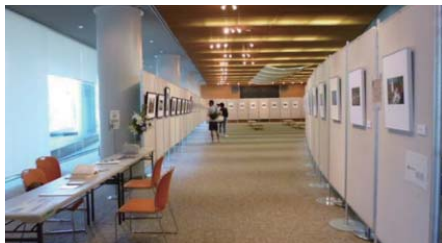
〒米子コンベンションセンター （☎35-8111 FAX 39-0700）