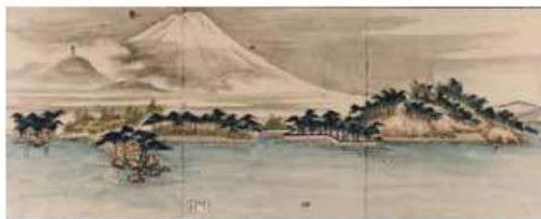
中海からの眺望 片山楊谷筆 寛政9年(1797) 当館蔵