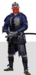
桃形兜 安土桃山時代 当館蔵