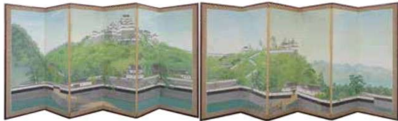
米子城屏風 井上迪彦筆 昭和後期 当館蔵