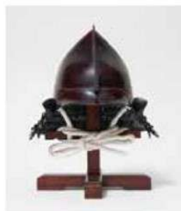
2020年指定 米子市指定有形文化財