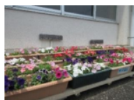
米子高校から鮮やかに咲いたプランターをお預かりしました。