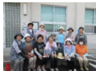
米女保護女性会の皆さんにお花を植えて頂きました。