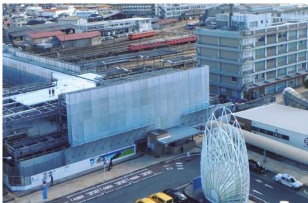
▲米子駅北側（12月9日撮影）