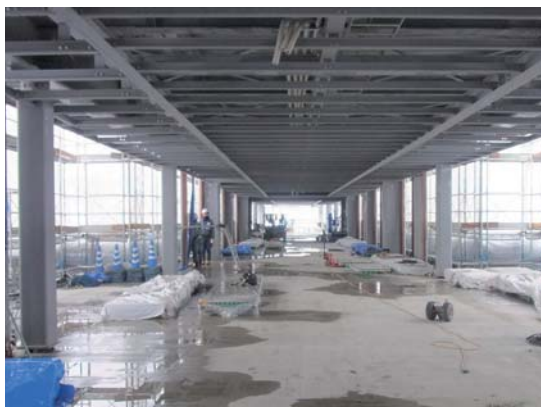
▲がいなロード中央（12月20日撮影）