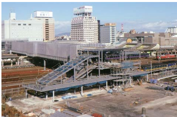
▲米子駅南側（12月9日撮影）