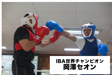
IBA世界チャンピオン 岡澤セオン