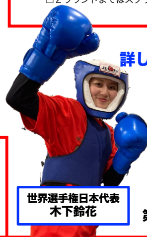
世界選手権日本代表 木下鈴花