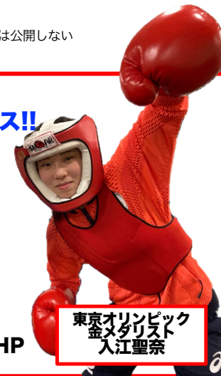
東京オリンピック 金メダリスト 入江聖奈