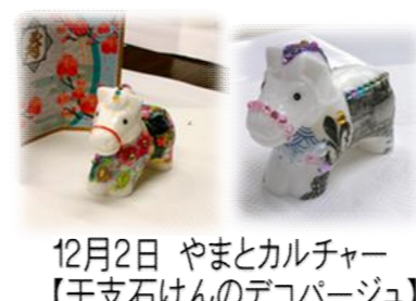
12月2日 やまとかルチャー 【干支石けんのデコパージュ】