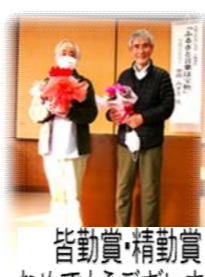
皆勤賞・精勤賞 おめでとうございます!