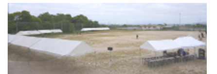
全クラスのテント