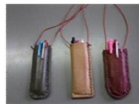
船上山少年自然の家 HP