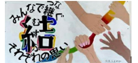
スローガン (美術部制作)

今年度より、本校では学校行事の平日開催を進めています。今回の体育祭は初めての平日開催となりましたが、保護者・地域の皆様には多くの方にご来校いただき、誠にありがとうございました。多くの皆さまからの温かいご声援は、生徒たちの大きな力になりました。これからもご協力をよろしくお願いいたします。