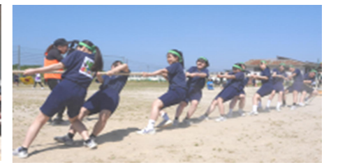
3年 綱を引くだけじゃダメですか？