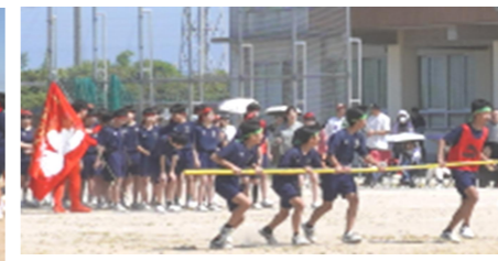
2年 ぐるぐるパニックレース