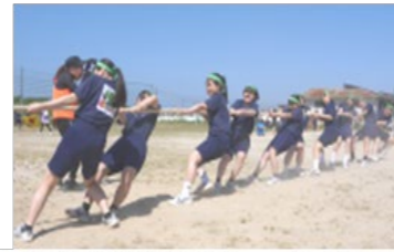
3年 綱を引くだけじゃダメですか?