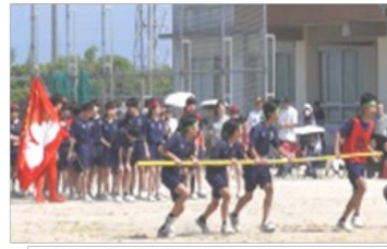
2年 ぐるぐるパニックレース