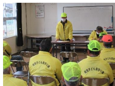
会議の中での情報交換

1月15日(月)に『子ども見守り隊』で下校時にパトロールをしました。寒空の中でしたが、団員のみなさんは【黄色いジャンパー】を着て子どもたちが安全に帰宅できるよう声かけをしながら夜見町を見回りました。