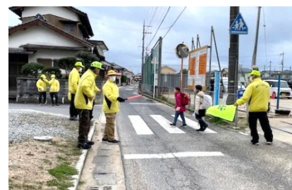
下校時の見守り『おかえり～気をつけて帰ってね～』