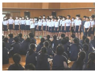
小学生からのお礼のサプライズ合唱です

中学生が行事全体の司会進行を行いました。中学生が小学校低学年の児童に優しく接している姿や小学生が中学生に負けないように一生懸命跳んでいる姿が見られました。また、それぞれの代表児童生徒のあいさつも大変すばらしかったですし、最後には、小学生から中学生にお礼の歌が披露されるなど、全体として、とても温かい雰囲気の中での行事となりました。