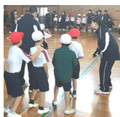
跳ぶタイミングを伝えています