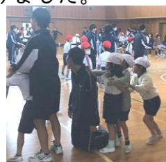
中学生も楽しそうです

令和5年11月20日(月)に、弓ヶ浜中学校区アフターコロナ行事「校区小学校対抗大縄跳び大会」を行いました。この行事は、新型コロナウイルスの感染拡大のために、この数年各小学校で実施を見送っていた「大縄跳び(8の字跳び)」に、弓ヶ浜中学校区内の全児童生徒が挑戦する中で、小学生と中学生がお互いにコミュニケーションをとりながら、協力して目標(全員が跳べること等)を達成することによって、新たな希望や前向きな気持ちを持てるようにすることを目的としました。しかしながら、行事当日及びその前の週から、各学校でのインフルエンザの流行や体調不良者等の状況に配慮して全児童生徒(1042名)の参加を変更し、弓ヶ浜小学校全児童と弓ヶ浜小学校出身の弓ヶ浜中2年生との交流(約600名)となりました。