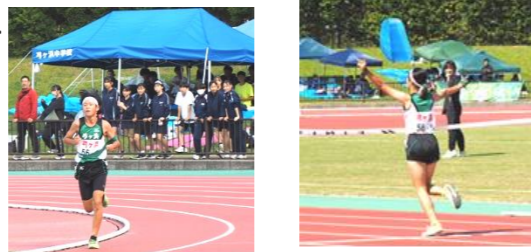
全員で男子アンカーを応援! アンカーで逆転し連覇達成