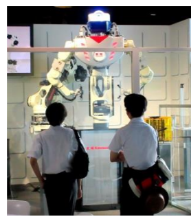
カワサキワールド