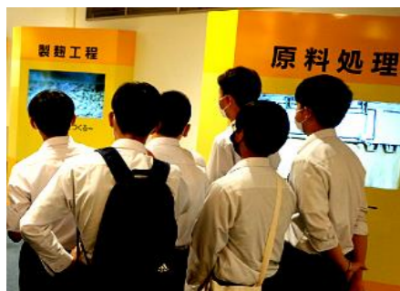
キッコーマン高砂工場

3年生が9/8(金)、9(土)、10(日)の3日間で、関西方面に修学旅行に出かけました。1日目は、クラスごとに分かれて企業見学(キッコーマン高砂工場、川崎重工業カワサキワールド、神戸市資源リサイクルセンター)を行い、昼食後に3年生全員で、人と防災未来センターで「防災学習」を行いました。