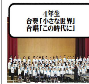
4年生 合奏「小さな世界」 合唱「この時代に」