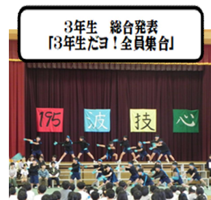
3年生 総合発表 「3年生だよ！全員集合」