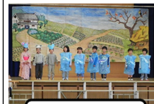
1年生 劇 「ねずみのよめいり」

ここから約一か月、2学期のまとめの時期に入ります。秋季運動会と学習発表会という2つの大きな行事を通して身に付けた力を、これからの学校生活で存分に発揮してくれることを期待しています。