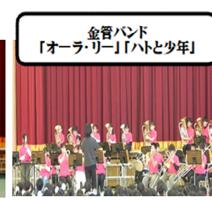
金管バンド 「オーラリー」「ハトと少年」