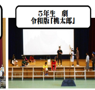
5年生 劇 令和版「桃太郎」