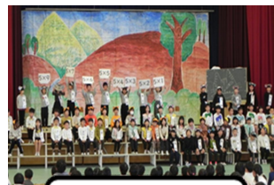
2年生 音楽劇 「ニャーゴ」