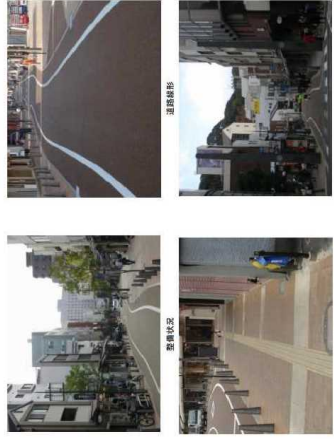
ウォーカーガブル路線イメージ