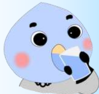
米子市水道局 PR キャラクター バッキン☆マン®

鳥取県西部地震から20年、災害の備えはお済みですか？ 水道局は、災害に強い水道づくりを進めています！