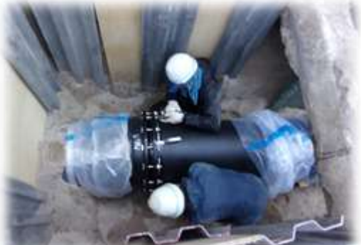
米子市富益町口径500mm配水管布設替工事