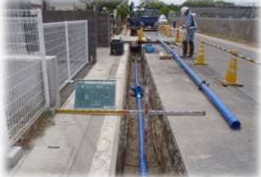
耐震管(配水用ポリエチレン管)の布設工事

公営企業として運営する水道事業は、お客さまにお支払いいただく水道料金を財源として経営しています。将来にわたって安心・安全な水道を安定してお届けするため、経費節減等の企業努力を強化するとともに、設備投資とのバランスに配慮した健全な水道事業経営に努めてまいります。