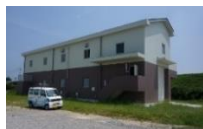
中央配水ポンプ場