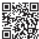
◀ 窓口の混雑状況 （米子市 HP）

スマートフォンなどから下記のQRコードを読み取ると、市民課や行政窓口サービスセンターの混雑状況が確認できます。ぜひご活用ください。