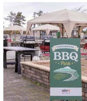
公園内の一番海側に開設