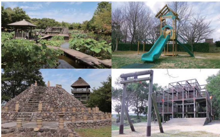
四季折々の自然も遊具も古代の文化も楽しめる