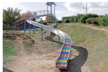
大きなローラー滑り台はなだらかで、小さなお子さんも大喜び！