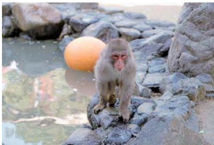
猿が島では猿を間近で観察できる