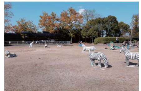
広場でのおんぶり過ごすのも◎