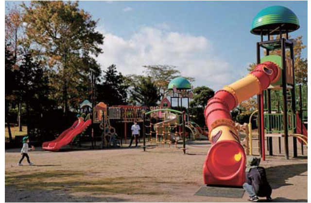
市内唯一の大型トンネル滑り台は昨年新たに設置

湊山公園は中海、城山、児童文化センターに囲まれたロケーションが魅力です。遊具で遊ぶのに疲れたら、猿が島で猿を観察したり、児童文化センターでプラネタリウムを楽しむのも良し。また、いつもの公園遊びに加えて、城山に登ったり、中海側の遊歩道を散策するのはいかがでしょう。