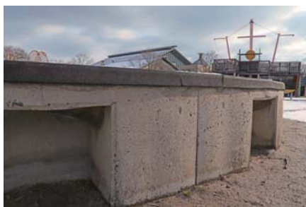
砂場は高さがあり、車椅子でも利用することができる（ユニバーサル遊具）