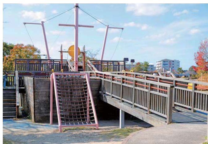
難破船の船首に立って、冒険家気分を味わおう！

弓ヶ浜公園は「誰もが楽しく遊べる公園」をテーマに、車椅子でも利用できる遊具（ユニバーサル遊具）を設置し、平成10年に開園しました。難破船をモチーフにした遊具や、ローラー滑り台、広い芝生広場などで思い切り遊べます。また、バスケットコート(3on3)やスケートパークがある公園は市内でここだけ！ぜひご利用ください。