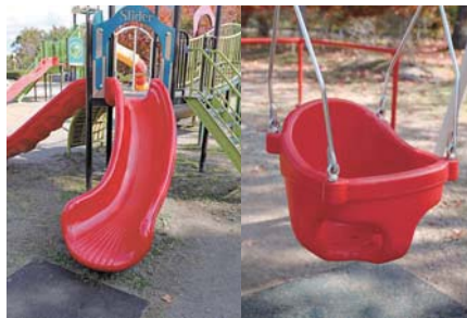
小さな子も楽しめる滑り台やブランコ