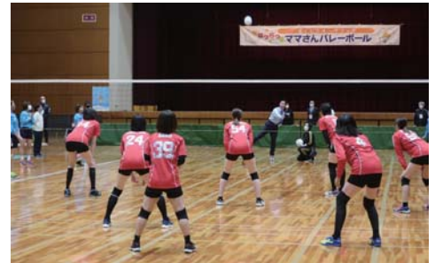
▲市長による始球式の様子