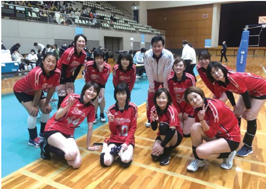
▲ドリームチーム集合写真