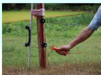
侵入防止柵の設置