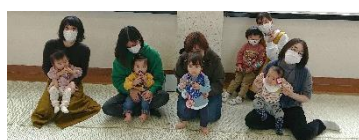
パンダクラブ（米東校区）