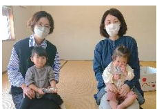
にしっこ（生西校区）

11月の定例会では、絵本やパネルシアターを楽しみました。その後、ドングリ☆マラカスを作りました。最後は歌に合わせて合奏しました♪