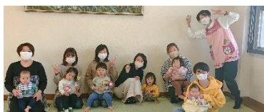
元気になる子育てクラブ（米西校区）