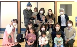
なかよしクラブ（生東校区）