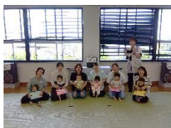
米西「元気が出る子育てクラブ」