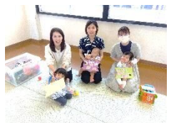
生東「なかよしクラブ」