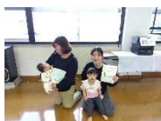
元気が出る子育てクラブ