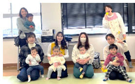
米西「元気が出る子育てクラブ」