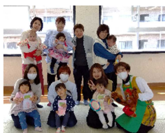
米東「パンダクラブ」