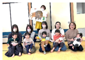
生東「なかよしクラブ」