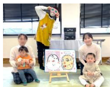
福米西 「元気が出る子育てクラブ」

1 月は恒例の福笑いを楽しみました。目隠しなしでも 面白い顔が完成して笑いの絶えないひとときでした。 工作は「紙コップ気球」を作りました。勢いよく飛び回る風船 に皆びっくり！おうちでも試してみてくださいね♪