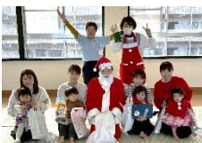
福米東 「パンダクラブ」

12月の定例会ではクリスマス会をしました。 クリスマスカード作りや手遊びの後 サンタさんが登場！ 楽しい会となりました。