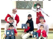
福米西 「元気が出る子育てクラブ」