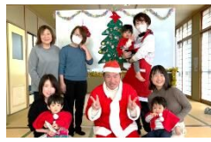
福生東 「なかよしクラブ」