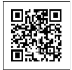
教育訓練講座 検索サイト