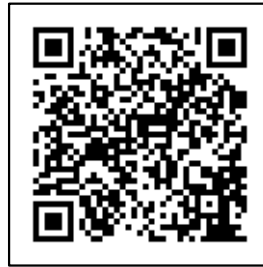
補助金に関する 市ホームページ