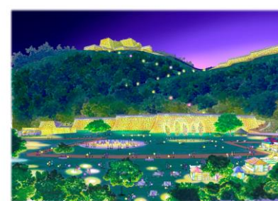
米子城跡活用イメージ図