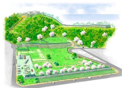
米子城跡整備イメージ図