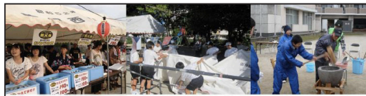
子供たちの“ふるさとを愛する心”が醸成されるように