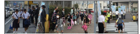
子供たちが毎日元気に楽しく学校に通えるように