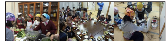
子供たちや家庭の課題が少しでも解決できるように