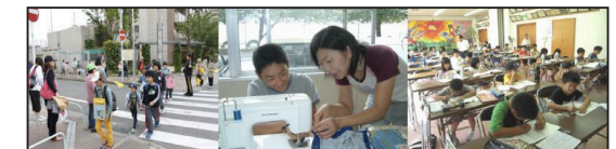
学校と地域とのつながりがより強固なものになるように