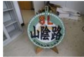
S L 山陰路