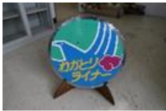
快速 わかとりライナー