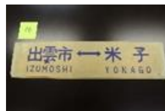
行先表示板 出雲市⇄米子