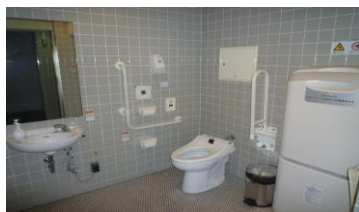
車いす使用者用トイレ