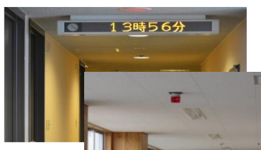
電光掲示板・フラッシュライト