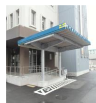
車いす使用者用駐車場、スロープ、手すり