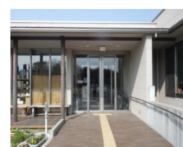
自動扉、点字ブロック等