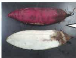
写真 サツマイモ基腐 特殊報(防除所)

詳しいことは、鳥取県病害虫防除所 HP 特殊報第1号(サツマイモ・基腐病 10月7日付発表)を確認してください。万が一、疑わしい症状等が発生したときは、最寄りの農業改良普及所、JA 営農センターにご相談ください。