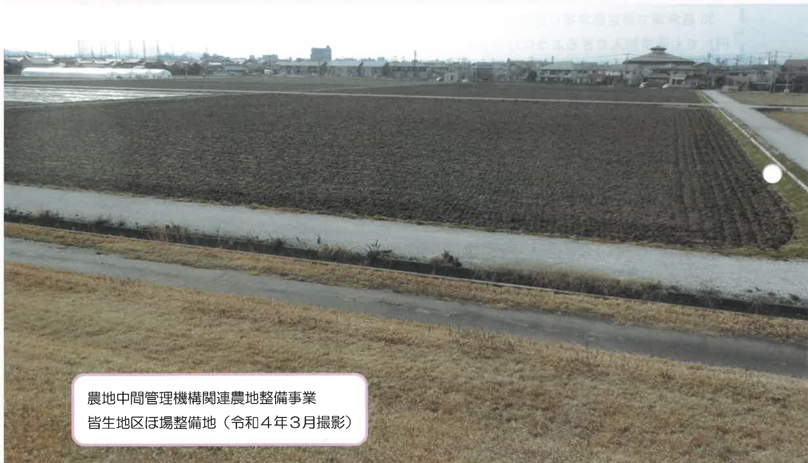
農地中間管理機構関連農地整備事業 皆生地区ほ場整備地（令和4年3月撮影）