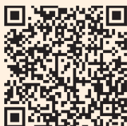
▲（一財）米子市学校給食会「今月の献立」

米子市の学校給食では6月の食育月間にあわせて他県の郷土料理や特産品を給食にとり入れた「ふるさと交流ウィーク」を実施しています。今年度は身近な中国地方の食文化を特集しました。