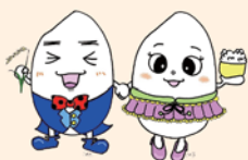
米子市学校給食キャラクター こめ太 こめ子

（☎ 33-4751、FAX 33-4757、✉ kyushoku@city.yonago.lg.jp）