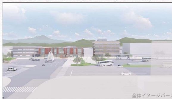
全体イメージパース