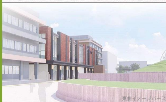
東側イメージパース