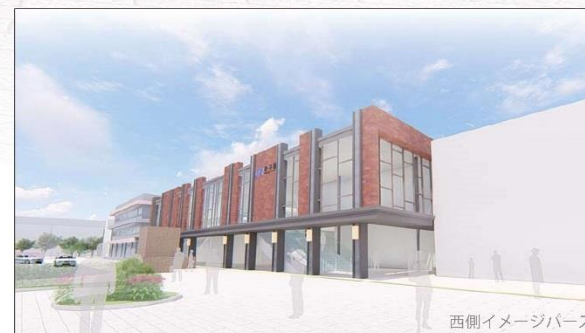
西側イメージパース