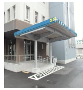
車いす使用者用駐車場、スロープ、手すり