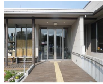
自動扉、点字ブロック等

特別特定建築物に該当すると、以下の整備に要する費用に対して、限度額の範囲内で3/4を補助します。