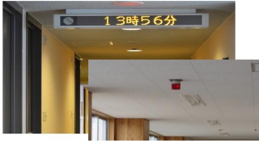
電光掲示板・フラッシュライト