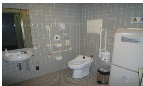
車いす使用者用トイレ