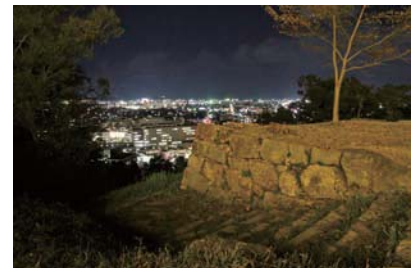
こんな夜景も見える！