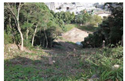
番所跡から二の丸が見える！