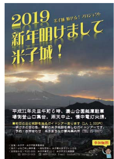
新年明けまして米子城！

米子城イベント満載の1年でした。新年のスタートも米子城で！次回もお楽しみに！（文化振興課）