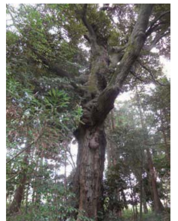
青木神社のスダジイ

の常緑針葉樹と「タブ」、「サカキ」、「モチノキ」、「ヤブツバキ」、「ナギ」の常緑広葉樹、「イチヨウ」、「ケヤキ」、「アオハダ」の落葉高木など豊富な種類がみられます。中でも幹周5.3m、樹高18mのスダジイは、確認できたものでは市内最大級で、樹齢400年と推定されています。ほかの樹木も巨大なものも多く、樹木の神を祀る神社の社叢の賞禄を感じることができます。青木神社に参拝した際は、社叢にも注目してみたいかがでしょうか。