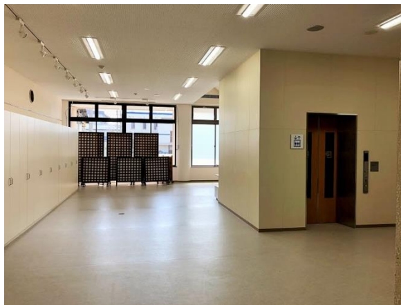
1階 ホール、エレベーター