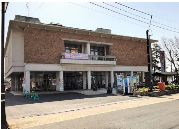
外観 ※建物外部は従前と同じ