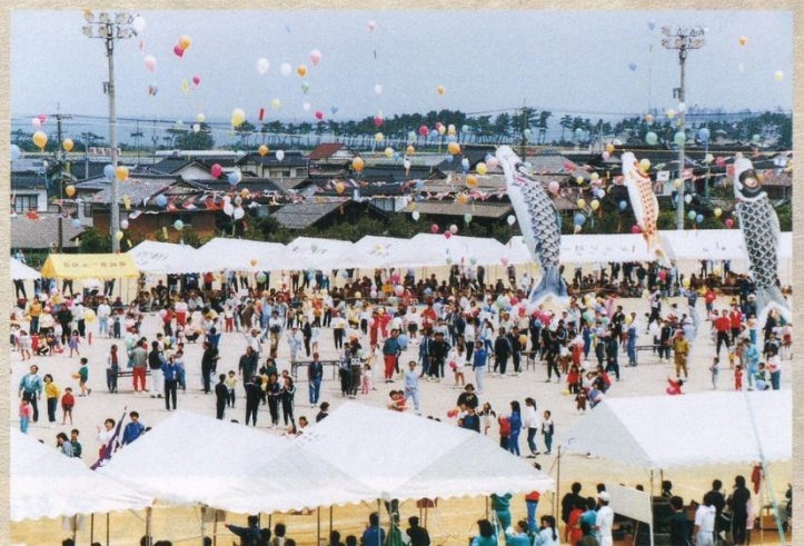
町制施行100周年淀江町運動公園で記念体育大会