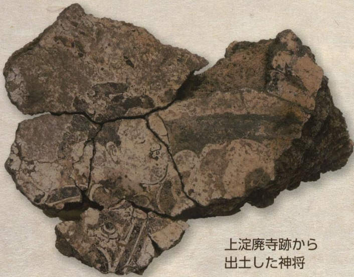
上淀廃寺跡から 出土した神将