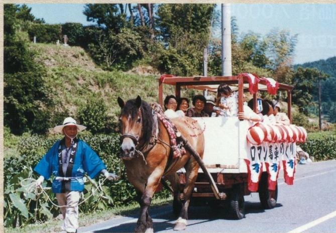
子どもたちに大変喜ばれたロマン馬車