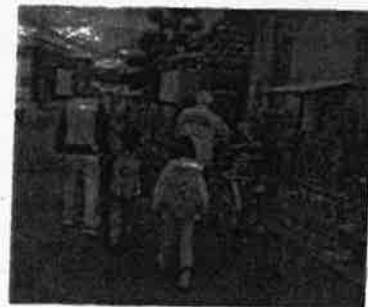
地域の見守り活動