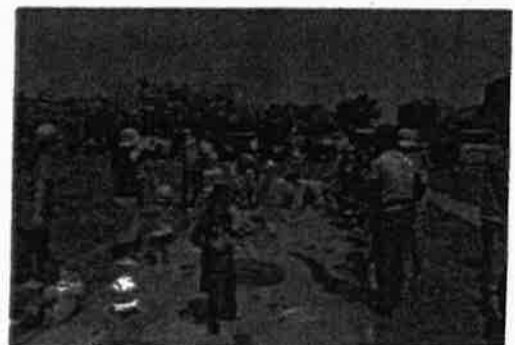
米子市児童文化センター事業 (こいのぼりに入っちゃお)