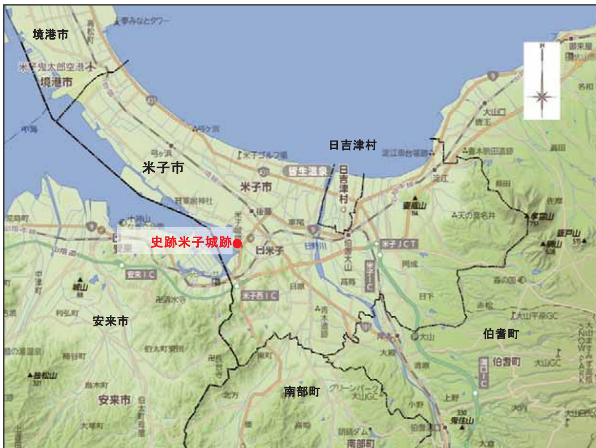
史跡米子城跡位置図