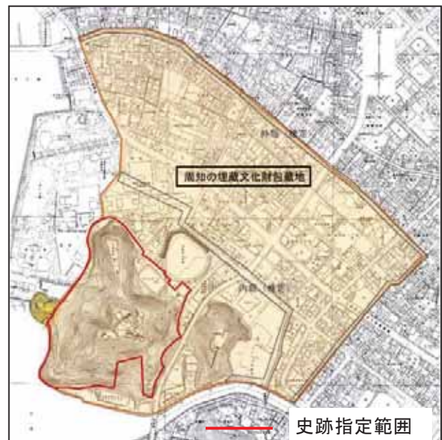
周知の埋蔵文化財包蔵地の範囲