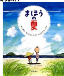
『まほうの夏』 藤原 一枝 // 作、はた こうしろう // 作・絵 (岩崎書店)

ざあざあぶりのにわかあめ。 フタくんは大きな木の下であまやどりした はすなのに、なぜかびしょぬれに…。 どうしてびしょぬれになったのか!? ページをめくるのが楽しくなる1冊です。