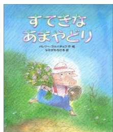
『すてきなあまやどり』 バレリー ゴルバチョフ // 作・絵 (徳間書店)

気象予報士のかたつむりが「梅雨明け はもうすぐでしょう」と伝えると、「み んなに知らせますか」と太陽さん。メ ロン、スイカにセミ、カブトムシ…夏 の風物詩がつつぎにでできます。 夏はどうやってくるのがユーモアた っぷりに描かれています。