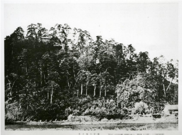
米子城（明治11年）