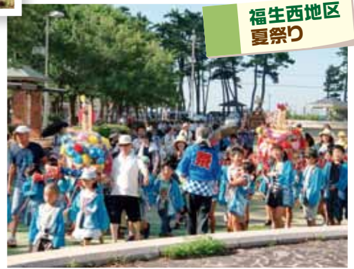
福生西地区 夏祭り