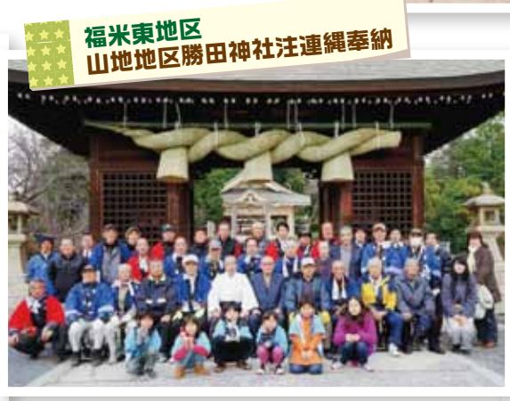
福米東地区 山地地区勝田神社注連縄奉納