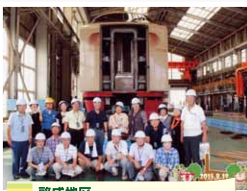
啓成地区 JIR西日本米子支社後藤総合車両所見学