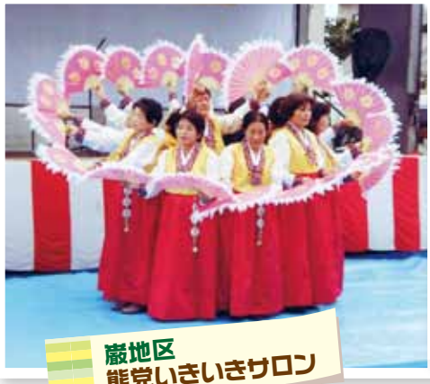
巖地区 熊党いきいきサロン