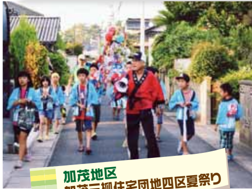
加茂地区 加茂三柳住宅団地四区夏祭り