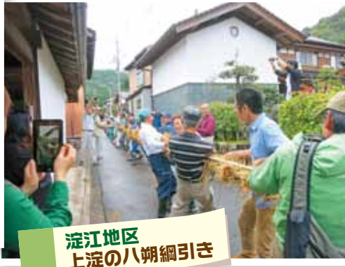
淀江地区 上淀の八朔綱引き