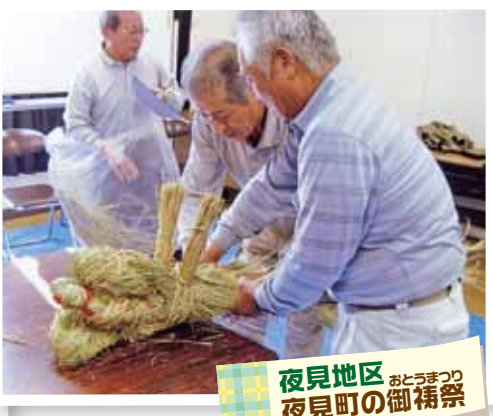
夜見地区 おとうまつり 夜見町の御禊祭