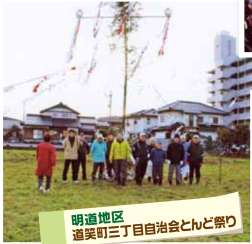
明道地区 道笑町三丁目自治会とんど祭り