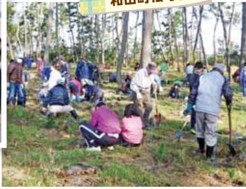
和田地区 和田町松守り隊