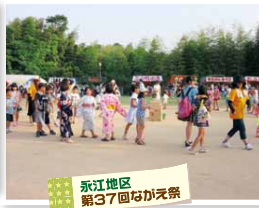
永江地区 第37回ながえ祭