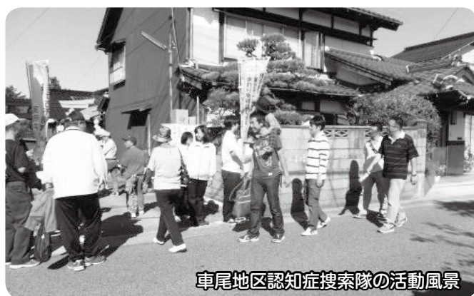
車尾地区認知症捜索隊の活動風景

この会議は、6つの専門部と自治連合会から構成され、各専門部が実施する地域づくり事業に多くの住民が参加できるように自治連合会や他の専門部が連携協力する体制の整備を目的としています。「人を大切にし 豊かな心を育む ふるさと車尾」のスローガンの旗の下、まさにオール車尾の体制で「住民自治のまちづくり」を目指しています。