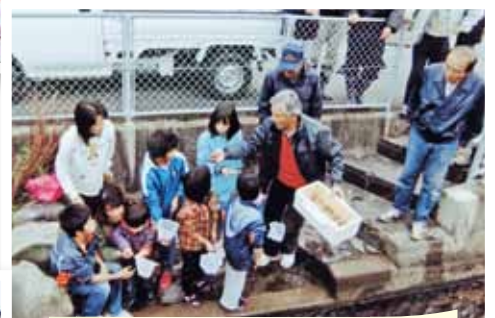
春日地区 ホタルネット春日 “ホタルの幼虫を放流する子ども達”