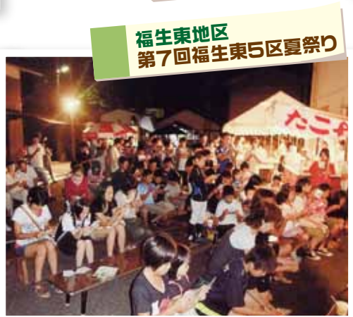
福生東地区 第7回福生東5区夏祭り