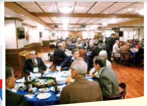
義方地区 義方地区コミュニティ協議会新年互礼会