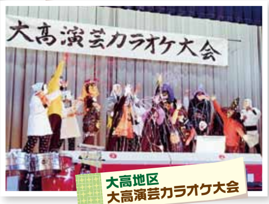
大高地区 大高演芸カラオケ大会