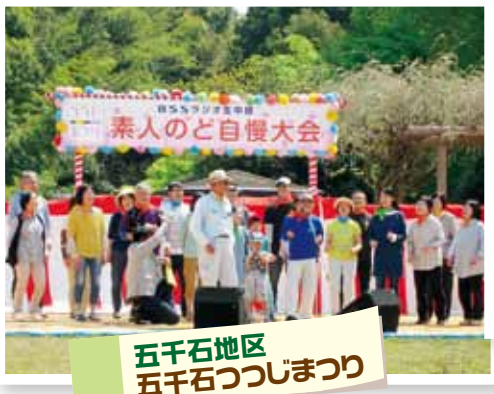
五千石地区 五千石つつじまつり