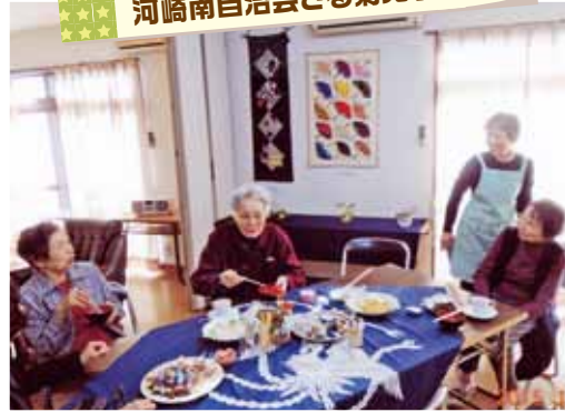
河崎地区 河崎南自治会さる菊見学交流会