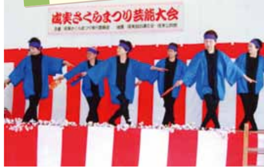
成実地区 成実さくらまつり