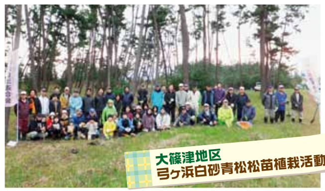
大篠津地区 弓ヶ浜白砂青松松苗植栽活動