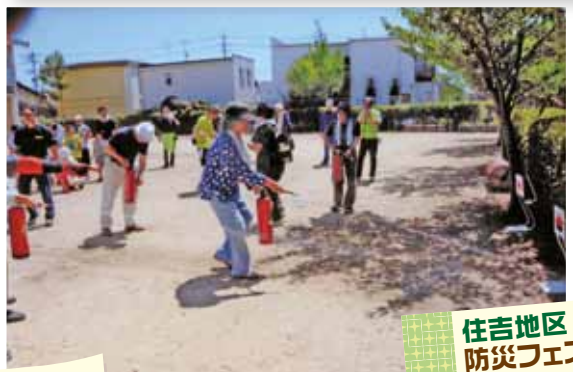
住吉地区 防災フェスティバル