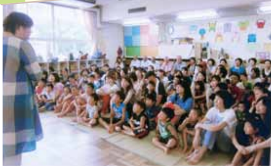
富益地区 家庭教育講座「ふれあいてたのしいな」