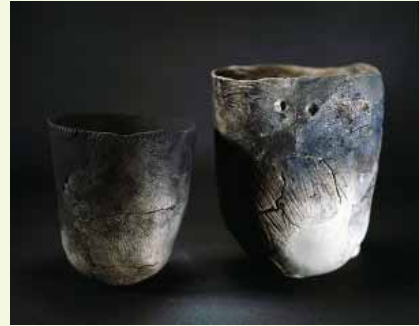
<写真> 縄文時代の土器

およそ1万年前から縄文時代が始まったんだ。米子市では、人びとがくらしした家のあとや、食べ物の じょうもん に た ほぞん どき 煮炊きや保存に使った「土器」という道具が見つかっているよ。それに、食べ物にした木の実や魚・動物の骨、貝がらもたくさん見つかっているんだ。