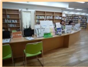
カウンター いりぐちをはいって左がわ。 本をかりたり、たずねたりする ところ。