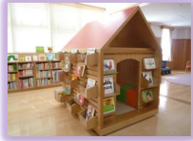
えほん たのしいえほんや かみしばいがいっぱい!