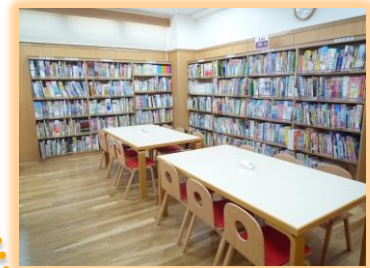
ちしき・しらべものの本 ひやかかじてん、ずかんなどのしらべ ものの本や、しゃかい、しぜんかがく などのちしきの本があります。せき にすわってよんだり、かいたりするこ ともできます。