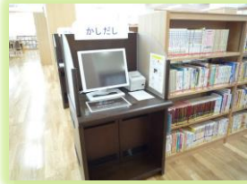
かしたしき けんさくき じぶんで本をかりたり、 けんさくもできるよ。