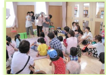
おはなしのへや くつをぬいでゆっくり本がよめます。 おはなしかいもしています。