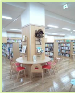
まるテーブルせき