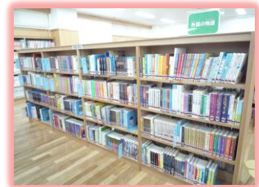
ものがたりの本 本のせかいをたのしもう!