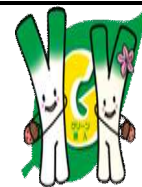
米子市グリーン購入適合紙を使用しています