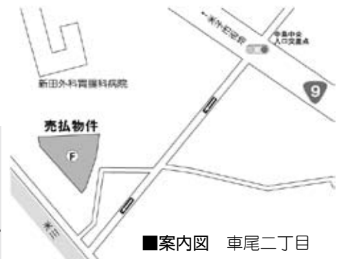
■案内図 車尾二丁目