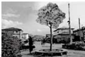
緑化施設 参考イメージ