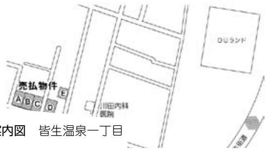
■案内図 皆生温泉一丁目