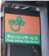
屋外広告物その他の 施設イメージ写真