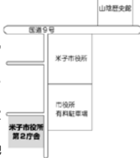
米子市役所第2庁舎案内図

■くわしくは、米子市行政窓口サービスセンター(☎39-0222)におたずねください。