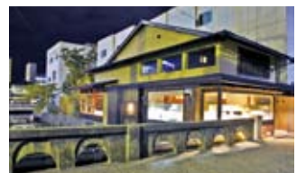
第2回 平成の都市景観施設賞授賞施設

し、審査結果を各人に通知するほか、米子市ホームページ、広報などに掲載し公表します。