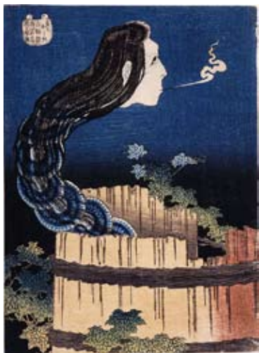
葛飾北斎《百物語 さらやしき》 1831（天保2）年頃

百物語とは、夏の夜に人々が集まって怪談話をするという、江戸時代に流行ったもので、百本の蠟燭に火を灯し、怪談を一つ話すごとに一つずつ火を消してゆき、最後の一本が消えて真っ暗になった時、恐ろしいことが起こるといふ言い伝えがありました。