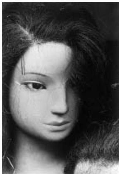
《マヌカン(1)》1954年 ゼラチン・シルバー・プリント/printed in 1992 30.0x20.5cm 米子市美術館 蔵