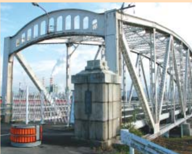
補強工事中の旧日野橋

まず「橋の上」という場所。橋は向こう(彼岸)とこちら(此岸)、言い換えればあの世とこの世をつなぐ所です。迷える魂である幽霊はあの世とこの世の接点・境界に姿を現すものなのです。