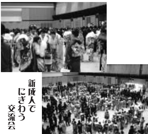
新成人で にぎわう 交流会

今日この感激を私たちの人生に活か し、名実共に成人となることを決意し て誓いの言葉とします。